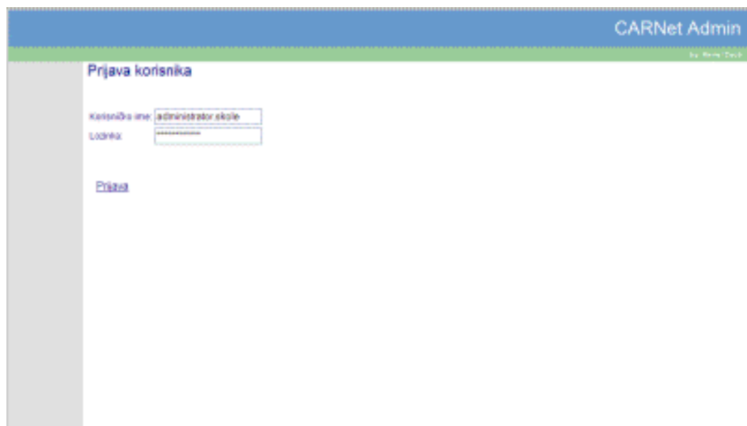
2.1 Prijava u sustav

I Važno je sačuvati ili zapamtiti korisničke podatke jer ih je, u slučaju gubitka, potrebno ponovno generirati!