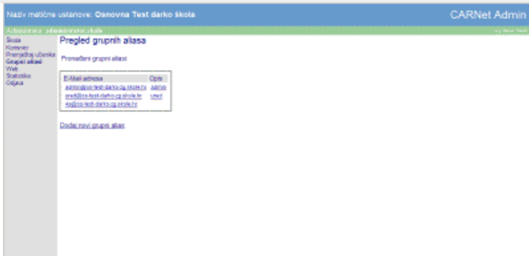
2.27 Pregled grupnih aliasa nakon dodavanja aliasa 4a