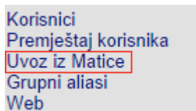
SLIKA 1. OPCIJA "UVOZ IZ MATICE"

Administrator imenika prijavljuje se sa svojim CARNet računom u HUSO aplikaciju na stranici admin.skole.hr. Potrebno je u izborniku s lijeve strane odabrati opciju „Uvoz iz Matice“ (slika 1).